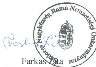
Farkas Zita Roma Nemzetiségi Önkormányzat Elnöke