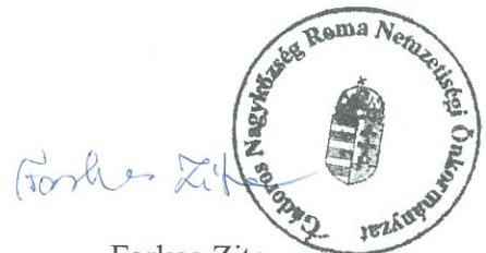
Farkas Zita Roma Nemzetiségi Önkormányzat elnöke