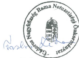
Farkas Zita Roma Nemzetiségi Önkormányzat Elnöke