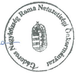
Farkas Zita Nemzetiségi Önkormányzat Elnöke