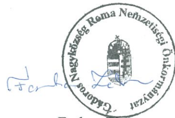
Farkas Zita Roma Nemzetiségi Önkormányzat Elnöke