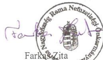
Farkas Zita Roma Nemzetiségi Önkormányzat Elnöke