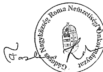
Farkas Zita Roma Nemzetiségi Önkormányzat Elnöke