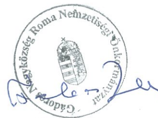
Farkas Zita Roma Nemzetiségi Önkormányzat Elnöke