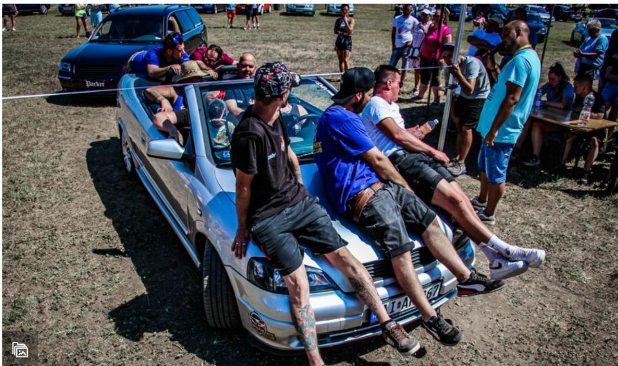
Autós piknik: bedübörögtek Gádorosra az autócsinostók és átépítők

Autós piknik volt ez a javából, hiszen 165 jármű érkezett Gádorosra szombaton. A látogatottsággal is elégedettek vagyunk, majd félezren jöttek el hozzánk. A hangulatra se lehet panaszunk. Beigazolódtott: van erre igény. Hagyomány lesz belőle, az már biztos. Mi, szervezők is tanulunk minden évben.