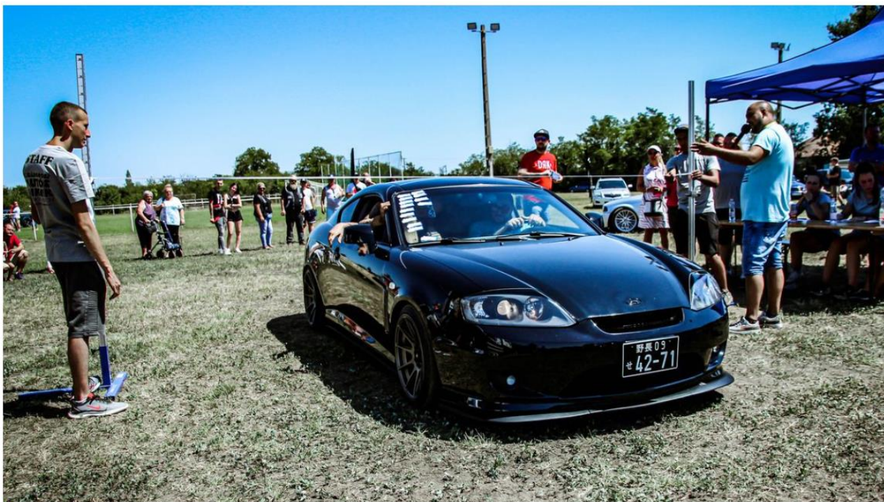
Autós piknik Gádoroson: az idei volt a második találkozó.

Az autós piknik jó buli volt. Látvány és sok játék, ismerős arcok és csillogó tuningos megoldások kívül s belül, legyen az világmárka, vagy szerény négykerekű.