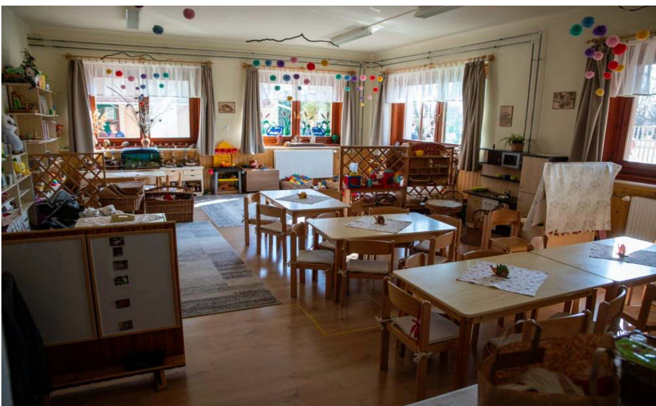
3 beruházást adtak át szombaton Gádoroson

– A Magyar Falu Program annak a bizonyítéka, hogy a kormánynak nagyon fontosak a kistelepülések, büszkék vagyunk erre a programra, hiszen jól látható, hogy Gádoros is megtalálta ebben a számítását. Az óvoda mellett ugyanis a könyvtár külső felújítása is ebből a forrásból valósulhatott meg, további 24,5 millió forintból – mutatta be a következő projektet az államtitkár.