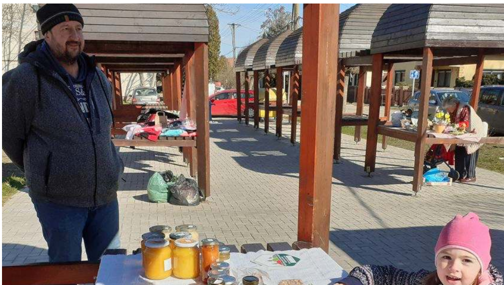
Megnyitott a Gádorosi kistermelői piac