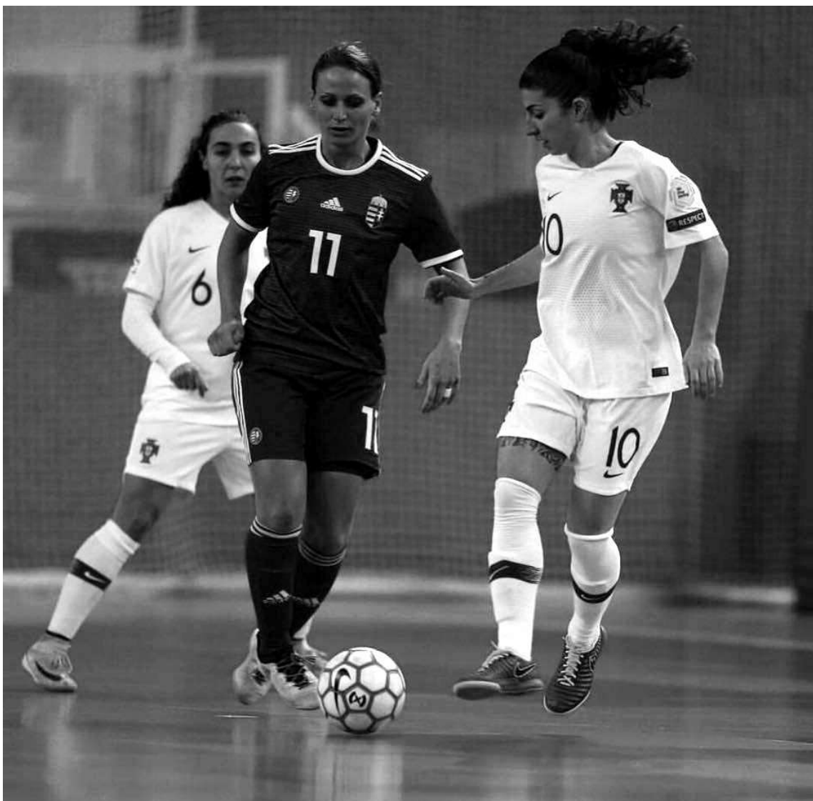
Portugáliában a válogatott tagjaként