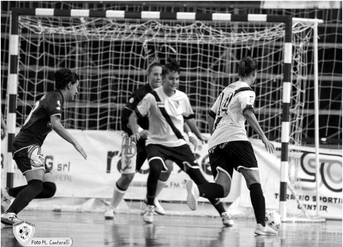
“Lanciano, az első olasz csapatom mezében”

– Olaszországban éltem a fénykorom 24-26 évesen. Rengeteget tanultam ott. Először a Lancianohoz kerültem, aztán egy csapatváltást követően még több lehetőségem lett fejlődni, és a Ternanával olasz bajnok lettem. Három éve mentem át Debrecenbe, az akkor még NB2-es csapathoz azzal a céllal, hogy egy olyan erős gárdát alakítsunk ki, mely képes feljutni az NB1-be. Ezt sikerült elérnünk, bajnokok lettünk, de a női futsal még rengeteg lehetőséget tartogat – folytatta.