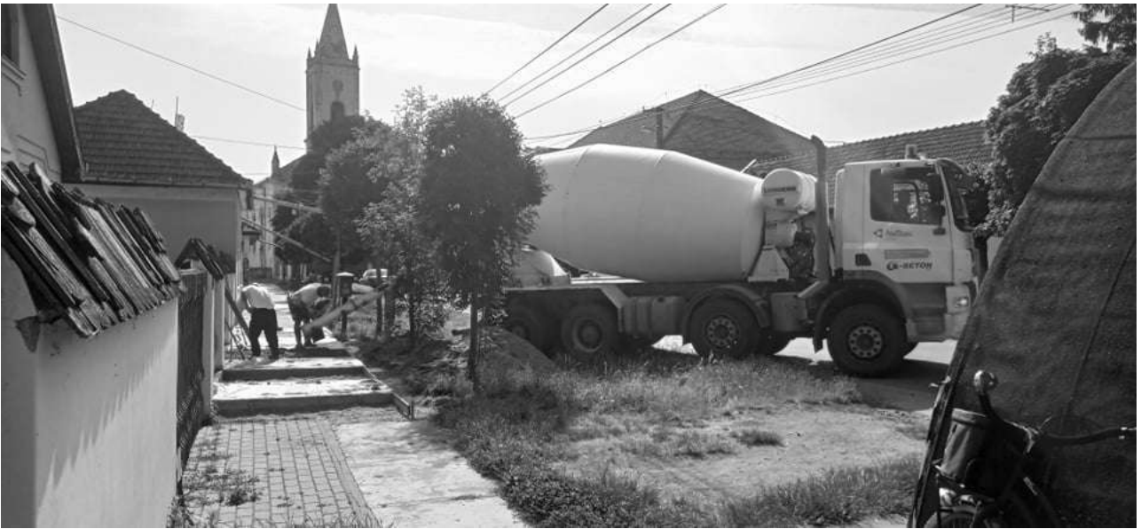
Tetőfelújítás az óvoda épületén: