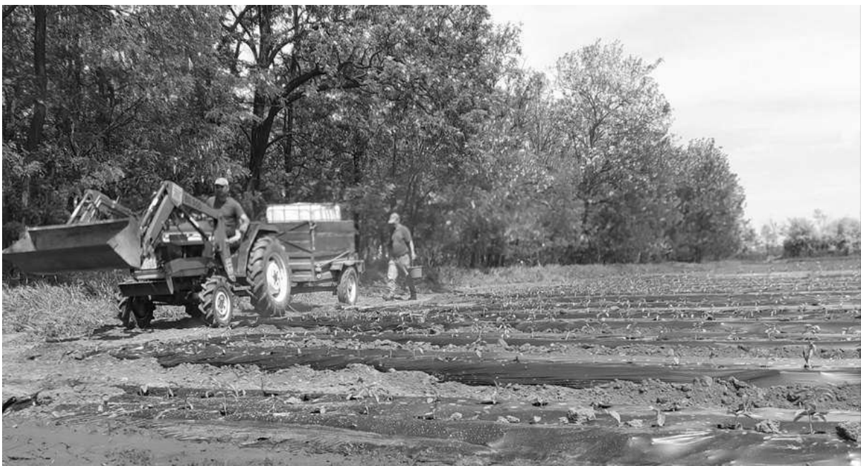
A palánták már a szántóföldön cseperednek

A polgármesterrel arra az önkormányzati földterületre is ellátogattunk, ahol éppen akkor fejezték be a fűszerpaprika-palánták kiültetését. Erősen tűzött a nap, de nem volt megállás, folyamatosan dolgoztak az emberek.