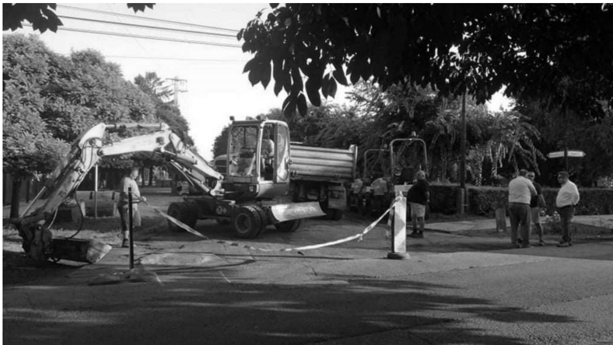
Egy hét alatt újították fel az Iskola utca burkolatát