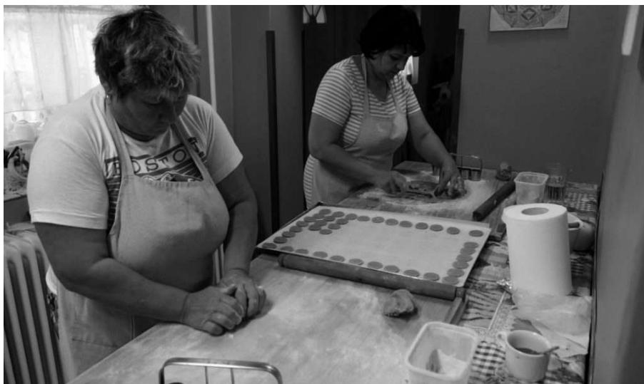
Készül a pilóta keksz alsó, fehér része