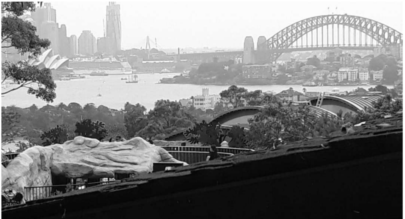
Füstös levegő Sydney felett

– A szilvesztert Sydneyben töltöttük, onnan a Grand Ocean Road-on keresztül, kempingezve akartunk visszatérni Melbournebe, de a bozóttüzek miatt evakuálták azt a kempinget is, ahova foglalásunk volt. Sydney-ben találkoztam egy családdal, akiket éjfélkor ébresztettek fel az egyik tengerparti kempingben, és közölték velük, hogy el kell hagyniuk a területet, ugyanis evakuálják az egész szabadidős területet, mert megváltozott szélirány miatt rohamosan közeledik a tűz. Amikor Sydneyből az autópályán haladtunk Melbourne felé, mi is elhajtottunk a tűz mellett. Utánunk nem sokkal lezárták az autópályát, a közeli várost is evakuálták. Albury-ben, ahol megálltunk kicsit felfrissülni, akkor 46 fok volt.