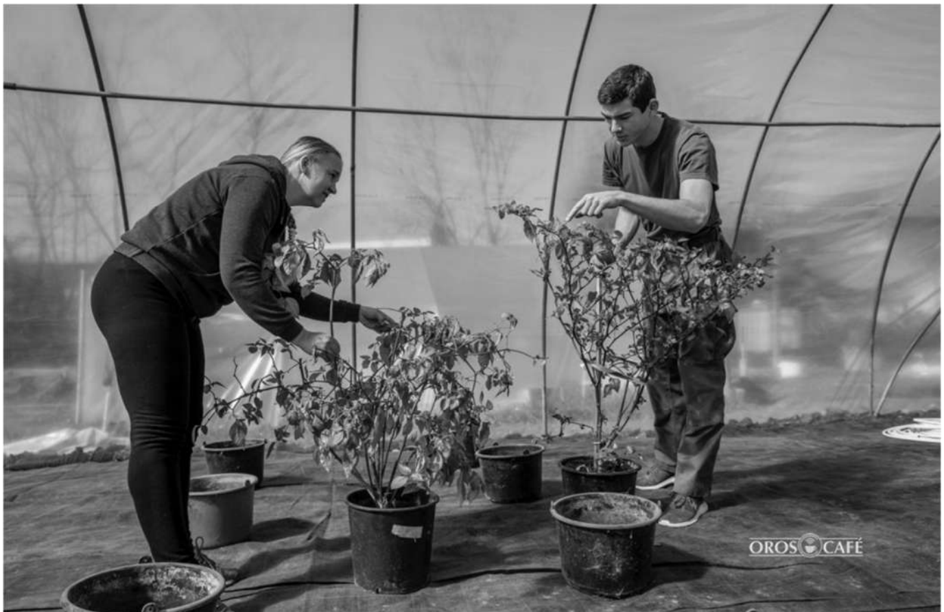
Automata öntözőrendszer segíti majd az egyenletes növekedést

– A tavalyi és tavalyelőtti sikerek után úgy gondoljuk, próbára tesszük magunkat: a Hun Hot összes kategóriájában nevezünk a termékeinkkel. A savanyúságok között mindenképp valami különlegessel kell előrukkolni, hogy labdába rúghassunk. A terv már körvonalazódik, de egyelőre gasztronómiai titok – mondja nevetve Adrienn. – A paradicsomos mártogatósunk adott, csak kicsit másképp kell elkészíteni, mint tavaly, gyümölcsös szószból kétféle van nekünk, ezúttal nem a szilvással indulunk, barbecue kategóriában új termékkel készülünk és a nagyon erősek között is nevezünk egy főzött krémmel – részletezi az előttük álló kihívást.