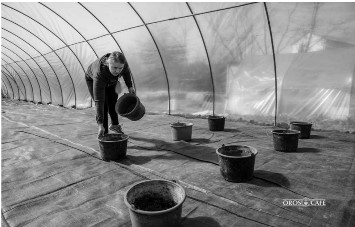
Hamarosan érkeznek az első palánták az új sátorba

– Már áll az új fólia, a régi helyére húztuk fel. Egy 27 méteres sátorról van szó, amely egyrészt nagyobb az előzőnél, kényelmesebben elférnek majd a paprikák benne, másrészt a palánták érkezéséig automatizálni is szeretnénk, azaz felszereljük csepegtetővel – foglalja össze Adrienn röviden a beruházást, amely számukra több pusztá számoknál. – Főként annak érdekében hajtjuk végre, hogy időt spóroljunk. Eddig minden egyes tövet kézzel, locsolóból öntöztünk, ami naponta körülbelül három órát vett igénybe. Idéntől ezt mással is tölthetjük, ami rendkívül nagy megkönnyebbülést jelent majd – teszi hozzá.