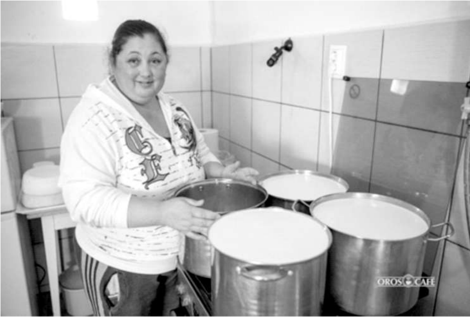
Napjai nagy részét a műhelyben tölti

Kicsivel később már fiatalok is érkeztek, akik többet szerettek volna megtanulni az alapoknál. Ők voltak az első haladók.