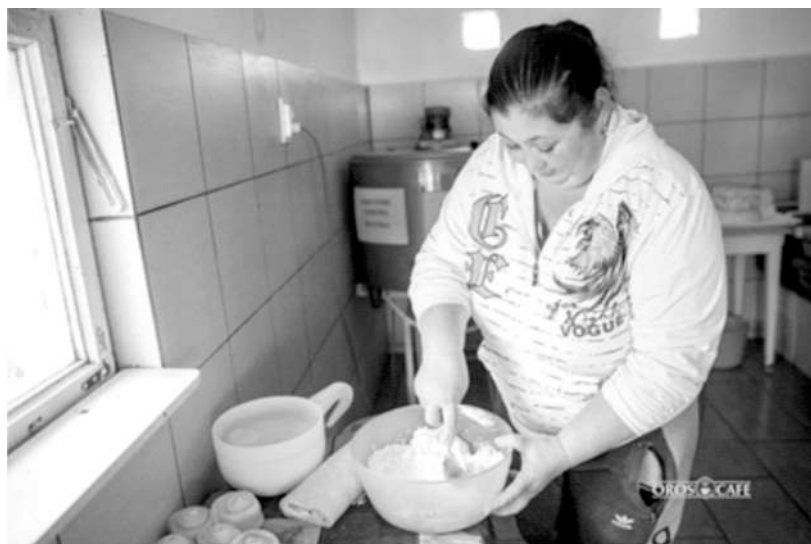
Újabb francia sajtokkal kísérletezik, és megszerezte a Mese sajt receptjét is

– Egy ismerősöm párja hozott nekem sajtot Franciaországból és valami mennyei volt. Persze rögtön az jutott eszembe, hogy ennek szeretném a receptjét, úgyhogy belevetettem magam az internetbe és kaptam is gyorsan egyet. Mostanra tíz receptet sikerült megszereznem, köztük olyat,