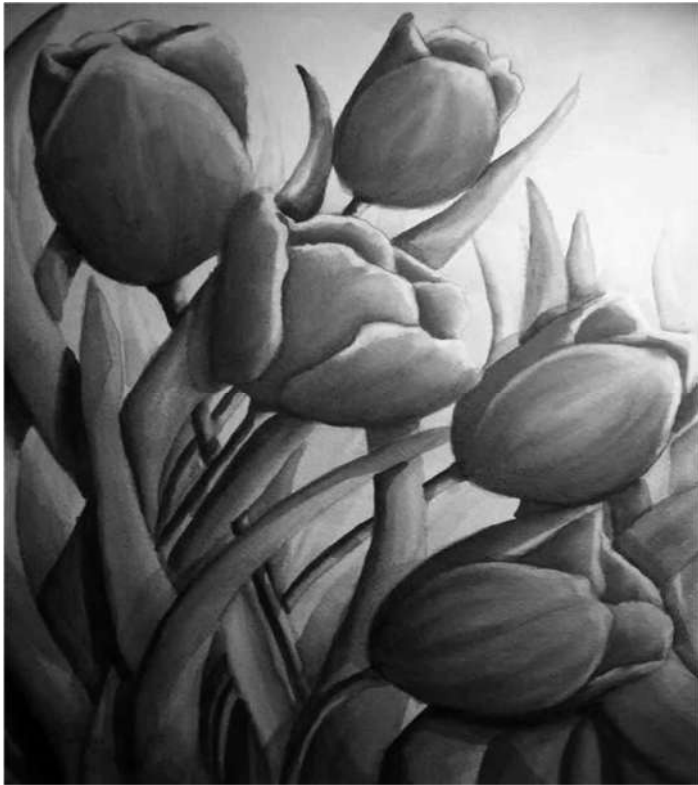
Gádoros Nagyközség Önkormányzata Képviselő-testülete