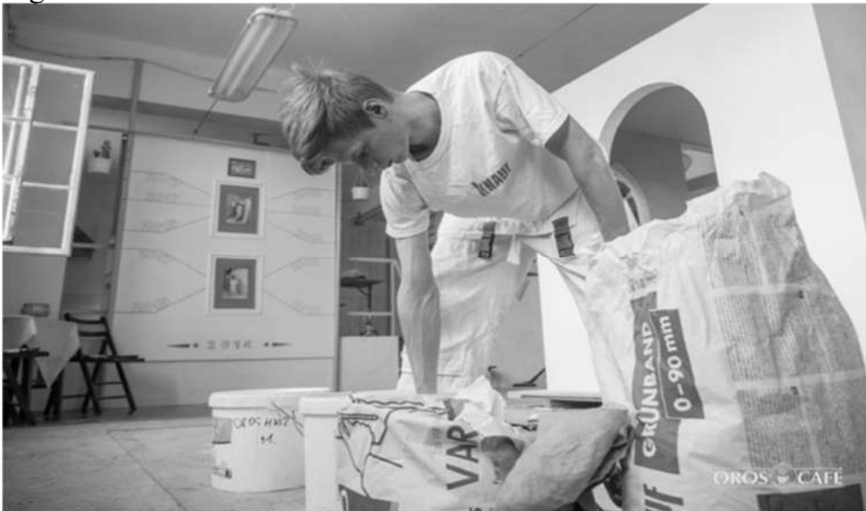
Először kőművesnek tanult, csak később választotta a szárazépítő szakmát

Rövid idő elteltével adódott egy lehetőség, hogy Muhel János versenyen indítsa az akkori végzős versenyzőket. Úgy gondolta, a két fiatalt is beteszi a csapatba tapasztalatszerzés céljából. Akkor egy új világ nyílt Márk és Gábor előtt. Az a csapat melyben Gábor kapott helyet az első, Márkéék pedig a második helyen végeztek.